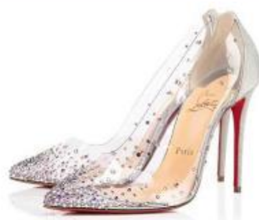
Modelo Degrastrass (original Christian Louboutin)