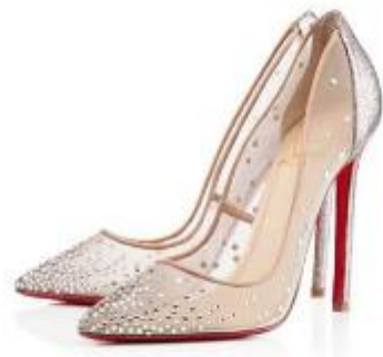
Modelo Body Strass (original Christian Louboutin)