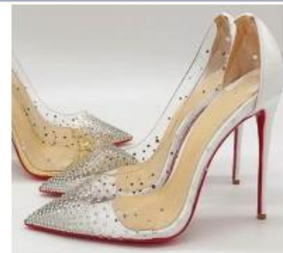
Modelo Cristal Princess White (cópia comercializada pela 1ª Ré)