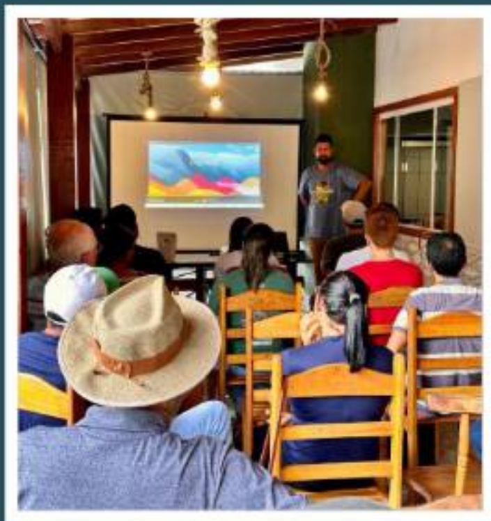
Palestra para adequação de rótulos à portaria do MAPA