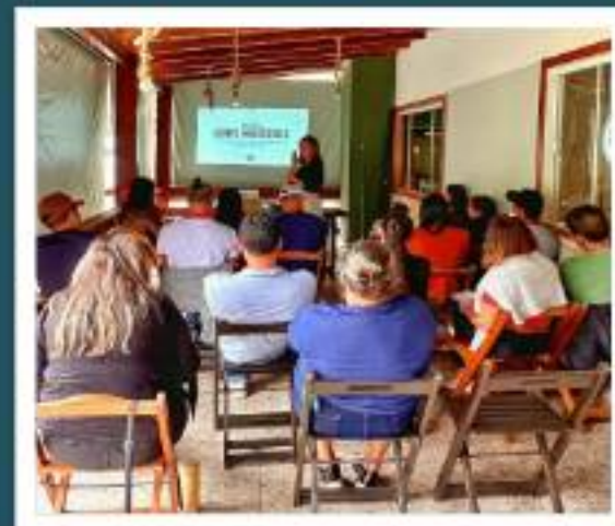
Palestra preparatória para SIC