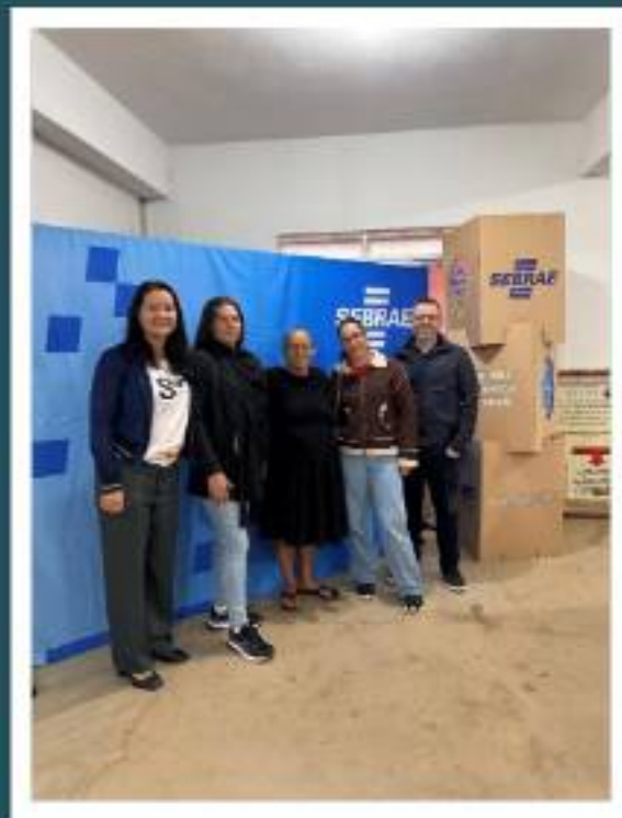
Consultoria em turismo de experiência