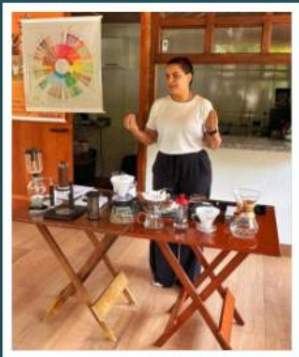
Oficina de preparo de cafés