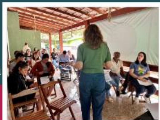
Oficina de pitch