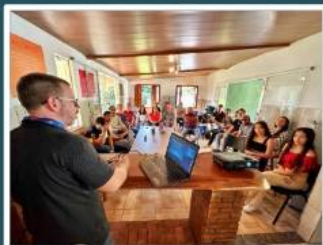
Oficina de Digitalização