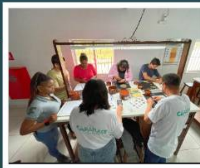
Oficina de classificação de cafés