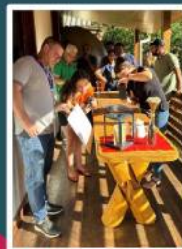
Oficina de fotos